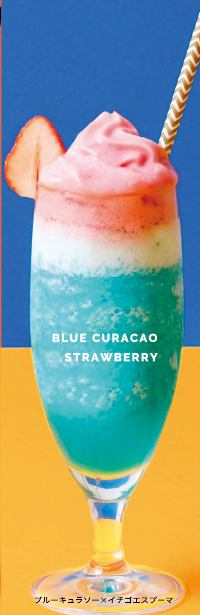
BLUE CURACAO STRAWBERRY

キウイジュース：60g ダイヤアイス：120g キウイシロップ：30g スムージーミックス：10g ×ヨーグルトエスプーマ